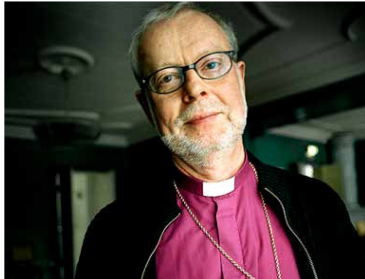
KG Hammar, ärkebiskop 1997–2006.