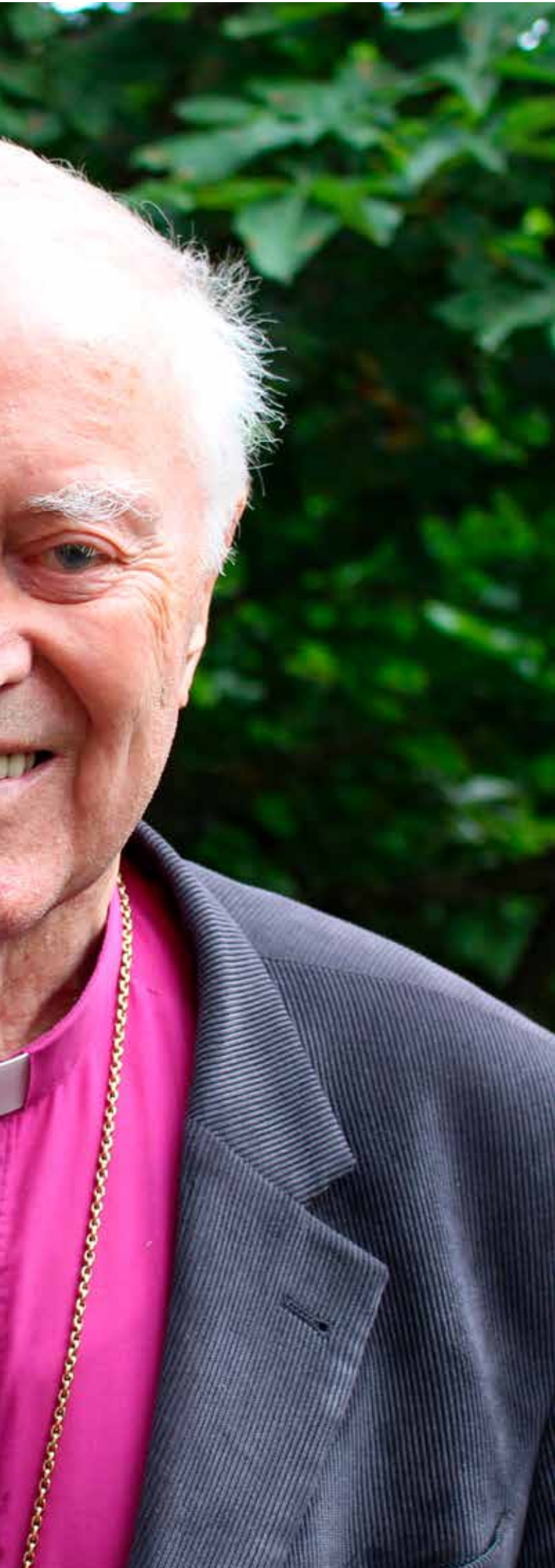
9 år och den här bilden är från år 2019.