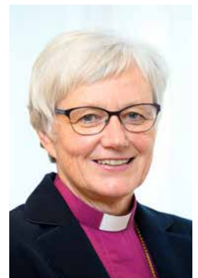
Nuvarande ärkebiskop Antje Jackelén.