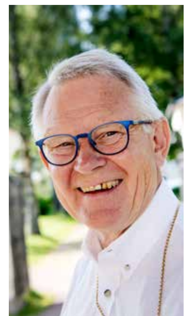
Anders Wejryd, ärkebiskop 2006–2014.